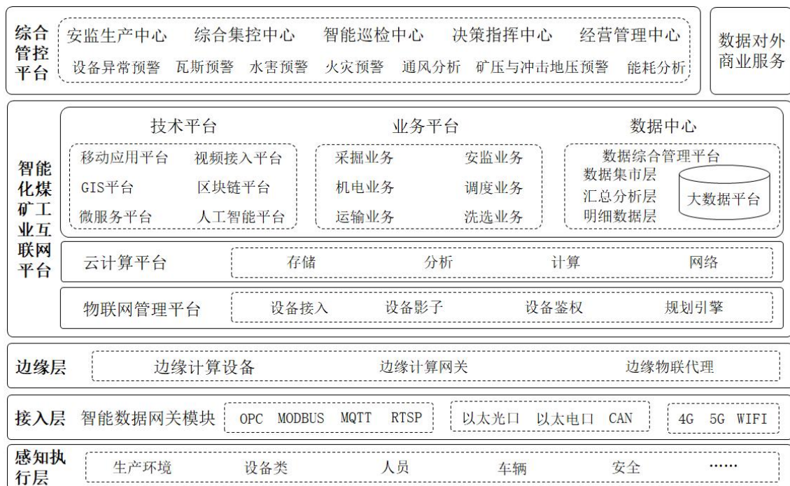
图 1 智能化建设参考技术架构

智能化煤矿应基于工业互联网平台的建设思路,采用一套标准体系、构建一张全面感知网络、建设一条高速数据传输通道、形成一个大数据应用中心,面向不同业务部门实现按需服务。井工煤矿、露天煤矿开展智能化建设可参考图 1 所示技术架构。